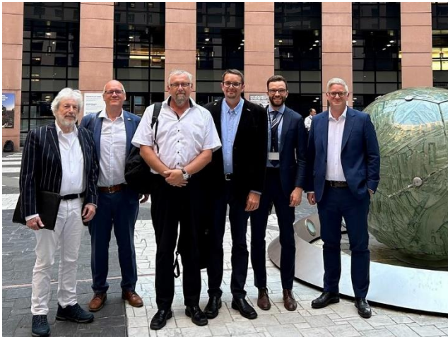
Overleg met European Parliament Historical Vehicle Group

Ook heeft de voorzitter van de commissie zitting in de Legislation-commissie van de FIVA.