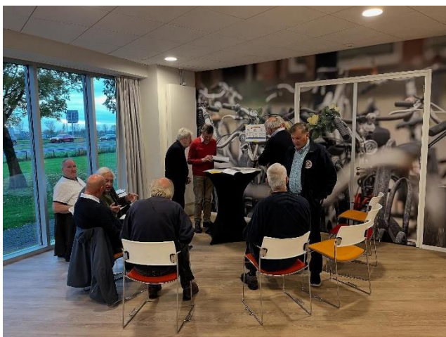
In kleine groepjes werken aan het Routeboek

interne serviceverlening te hebben voor bestuur, FEHAC vrijwilligers en aangesloten clubs.