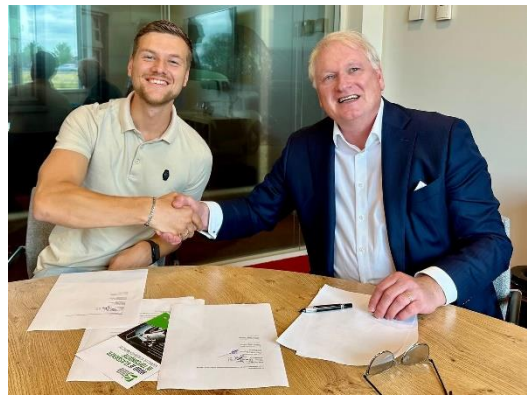
Samenwerking tussen ABC Automotive en VKI

In 2025 is er een initiatief genomen om juist het gecertificeerde deel van de VKI te stimuleren, zodat er meer gecertificeerde bedrijven komen, waardoor er -naast de inspectie via de clubs – ook voor de eigenaren die niet zelf sleutelen voldoende goede mogelijkheden zijn om hun klassieker in goede staat te houden. Dit is bewerkstelligd door een samenwerking tussen ABC Automotive en Stichting VKI in werking te zetten. Hierdoor wordt een ruimere markt aan VKI uitvoerende garagebedrijven aangeboord. Resultaten hiervan zullen vooral in 2026 zichtbaar worden.