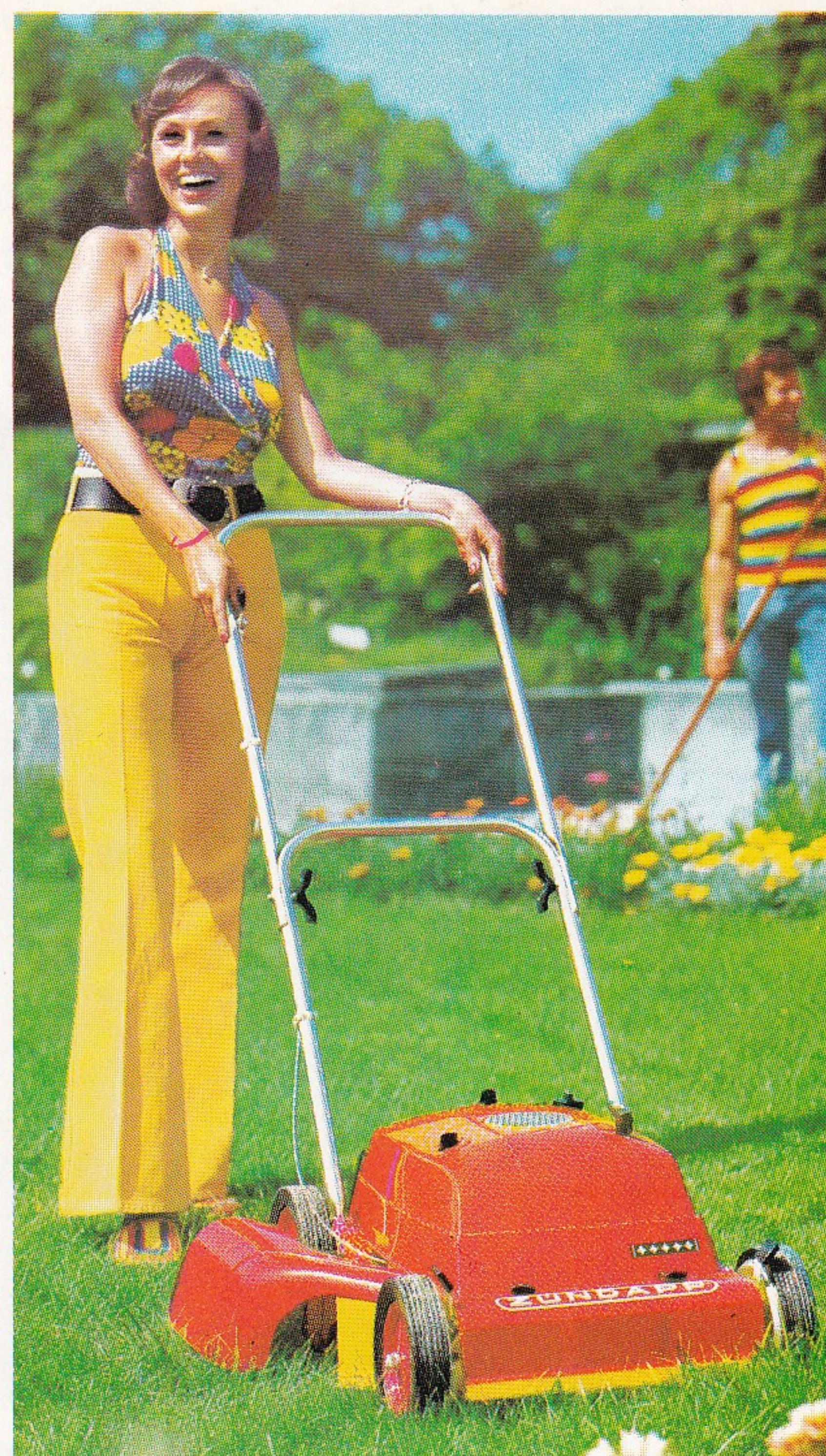
5-Stern-Modell Typ 685-05 ZÜNDAPP-Motor-Mäher , „unser Spitzenmodell“ mit Fahrtrieb und Elektrostart

Für Gärten bis ca. 1000 qm Rasenfläche. 3-PS-(2,2 kW) ZÜNDAPP-Zweitakt-Motor, 100 ccm. Extrem leise. 2-Finger-Leichtstart. Sicherheitsgehäuse aus Druckguß. Eingegossener Wurfkanal für optimale Grasförderung. Handgeschoben.