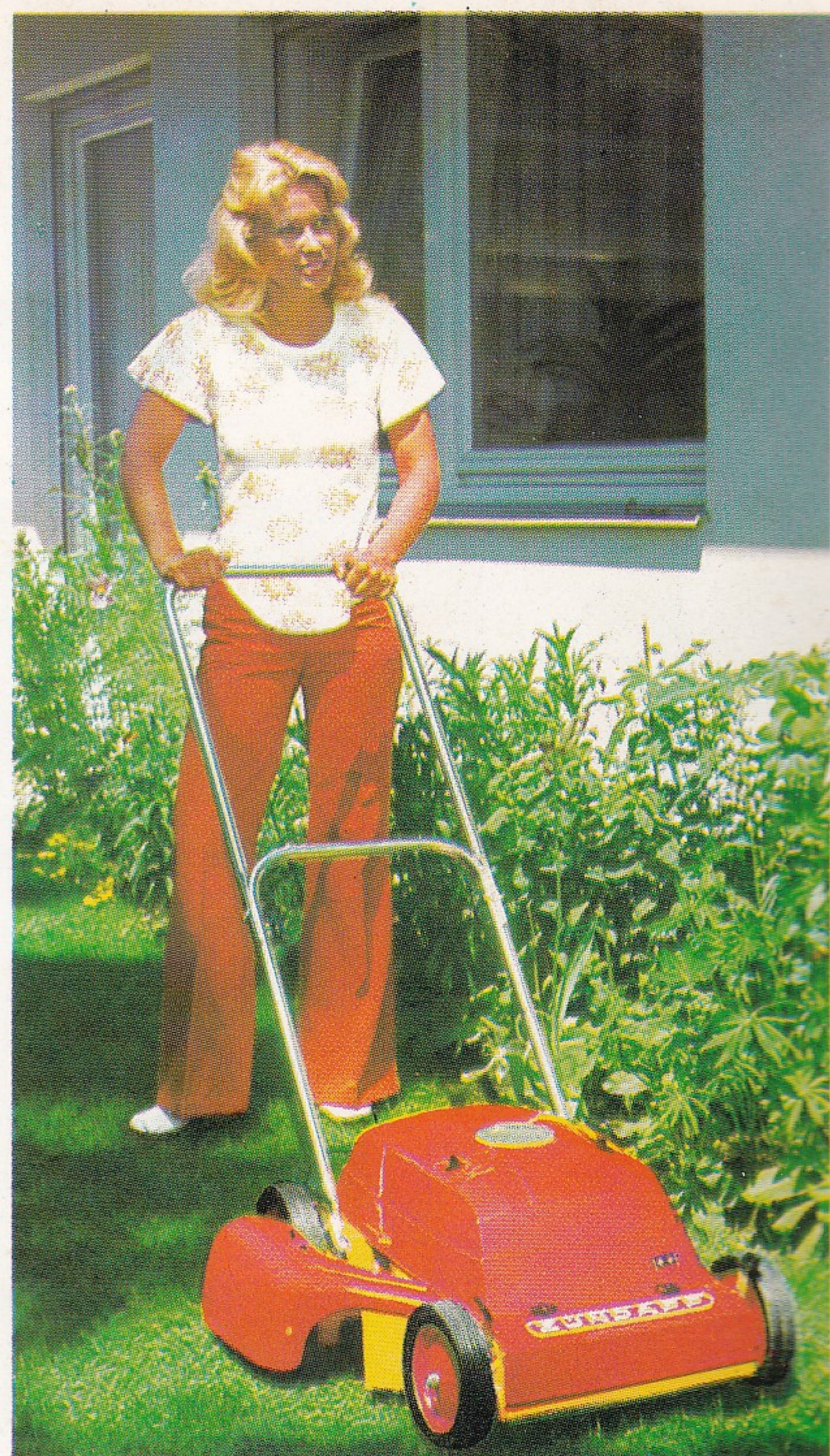
2-Stern-Modell Typ 685-01 ZÜNDAPP-Motor-Mäher – mit Radschnellverstellung und verchromtem Bügel

Für den mittleren Privatgarten. 3-PS-(2,2 kW) ZÜNDAPP-Zweitakt-Motor, 100 ccm. Extrem leise. 2-Finger-Leichtstart. Handgeschoben. Sicherheitsgehäuse aus Druckguß. Eingegossener Wurfkanal für optimale Grasförderung. Radverstellung durch Steckachsen in 3 Stufen. 46 cm Schnittbreite. Zubehör: Kunststoff-Grasfangsack.