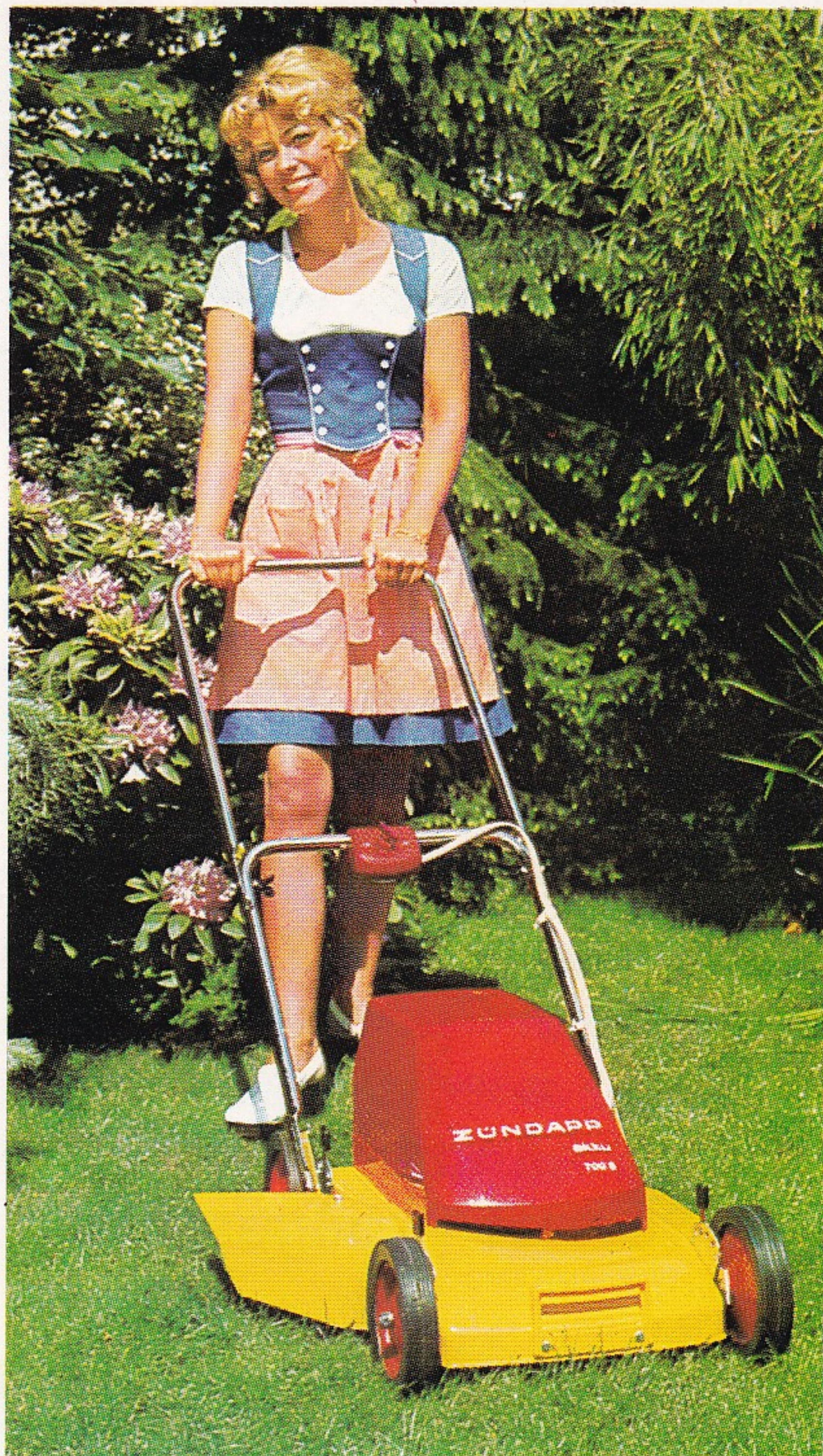
700 S Typ 688-01 ZÜNDAPP-akku-Mäher 700 S — Spitzen-akku in Qualität und Leistung

Für den mittelgroßen Privatgarten bis 1000 qm. 1000/500-Watt-Elektro-Doppelmotor, luftgekühlt. 12 Volt/45-Ah-Autobatterie. Steckdose für Batterie-Ladegerät und Zusatz-Gartengeräte. Eingebauter Wurfkanal. Einteiliges Spezialmesser, 35 cm Schnittbreite.