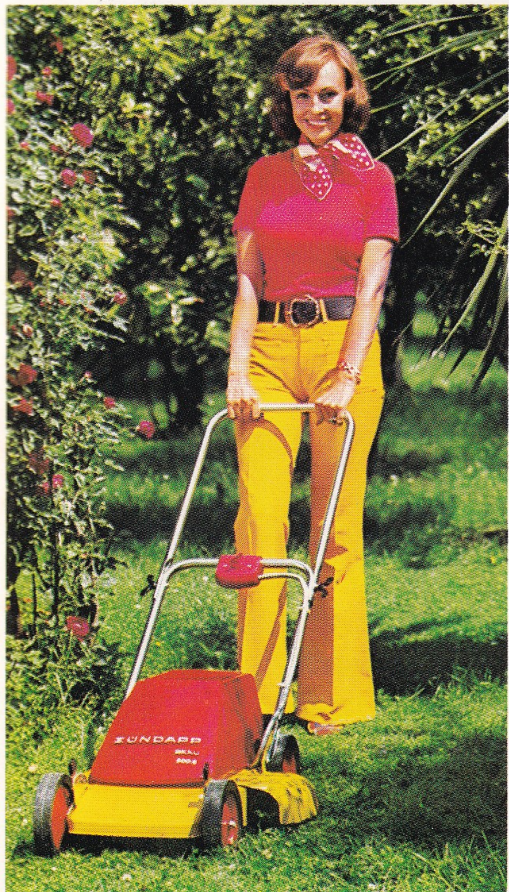
300 S Typ 686-02 ZÜNDAPP-akku-Mäher 300 S mit Radschnellverstellung

Radschnellverstellung in 5 Stufen. 46 cm Schnittbreite. Zubehör: Kunststoff-Grasfangsack.