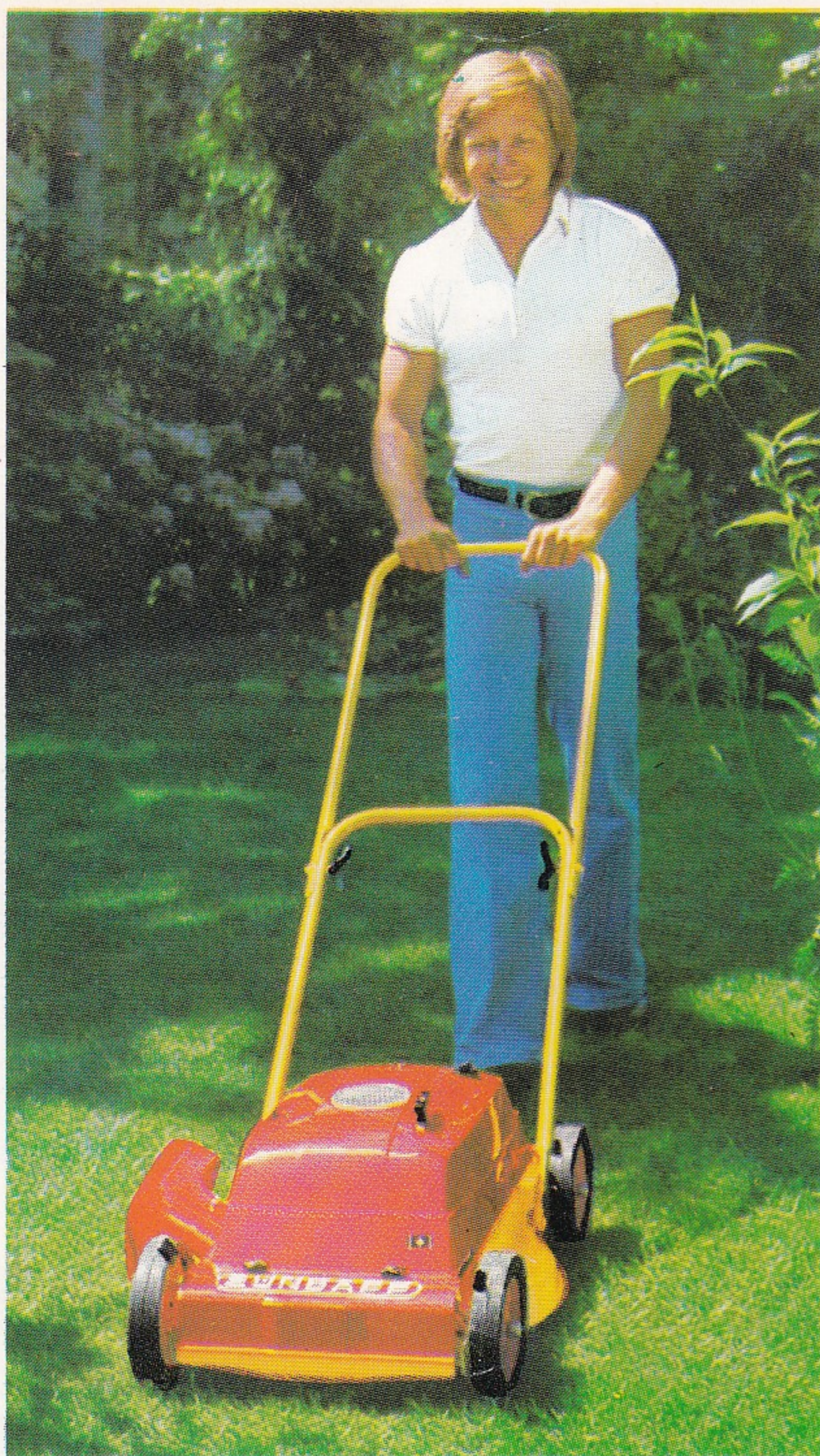
1-Stern-Modell Typ 685-02 ZÜNDAPP-Motor-Mäher, „Grundmodell“ der Luxus-Mäher-Klasse

Wählen Sie einen leisen ZÜNDAPP-Rasenmäher.