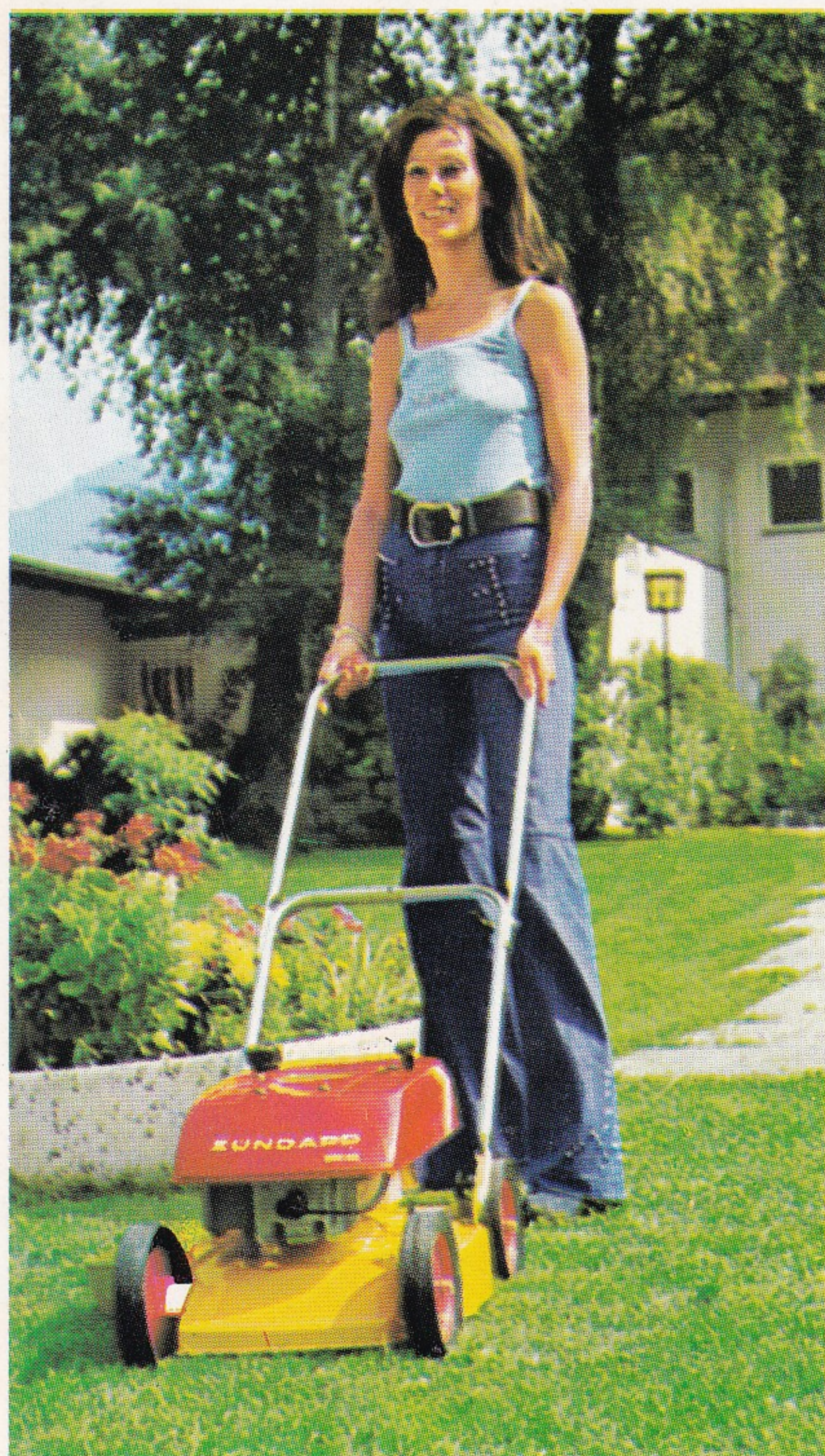
MM 20 Typ 687-01

Für den mittleren Privatgarten bis ca. 1000 qm. 3-PS-(2,2 kW) ZÜNDAPP-Zweitakt-Motor, 100 ccm. Extrem leise. 2-Finger-Leichtstart. Handgeschoben. Sicherheitsgehäuse aus Druckguß. Eingegossener Wurfkanal für optimale Grasförderung. Radschnellverstellung in 5 Stufen. 46 cm Schnittbreite. Zubehör: Kunststoff-Grasfangsack.