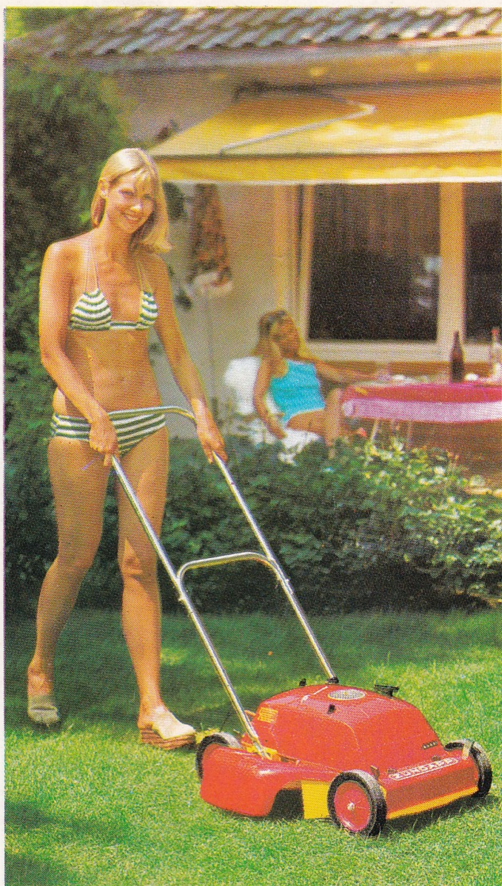
4-Stern-Modell Typ 685-04 ZÜNDAPP-Motor-Mäher — mit wartungsfreier, besonders startfreudiger elektronischer Zündanlage, Radschnellverstellung und verchromtem Bügel

Für größere Rasenflächen, speziell für Hanglagen. 3-PS-(2,2 kW) ZÜNDAPP-Zweitakt-Motor, 100 ccm. Extrem leise. 2-Finger-Leichtstart. Vorderradantrieb. Sicherheitsgehäuse aus Druckguß. Eingegossener Wurfkanal für optimale Grasförderung.