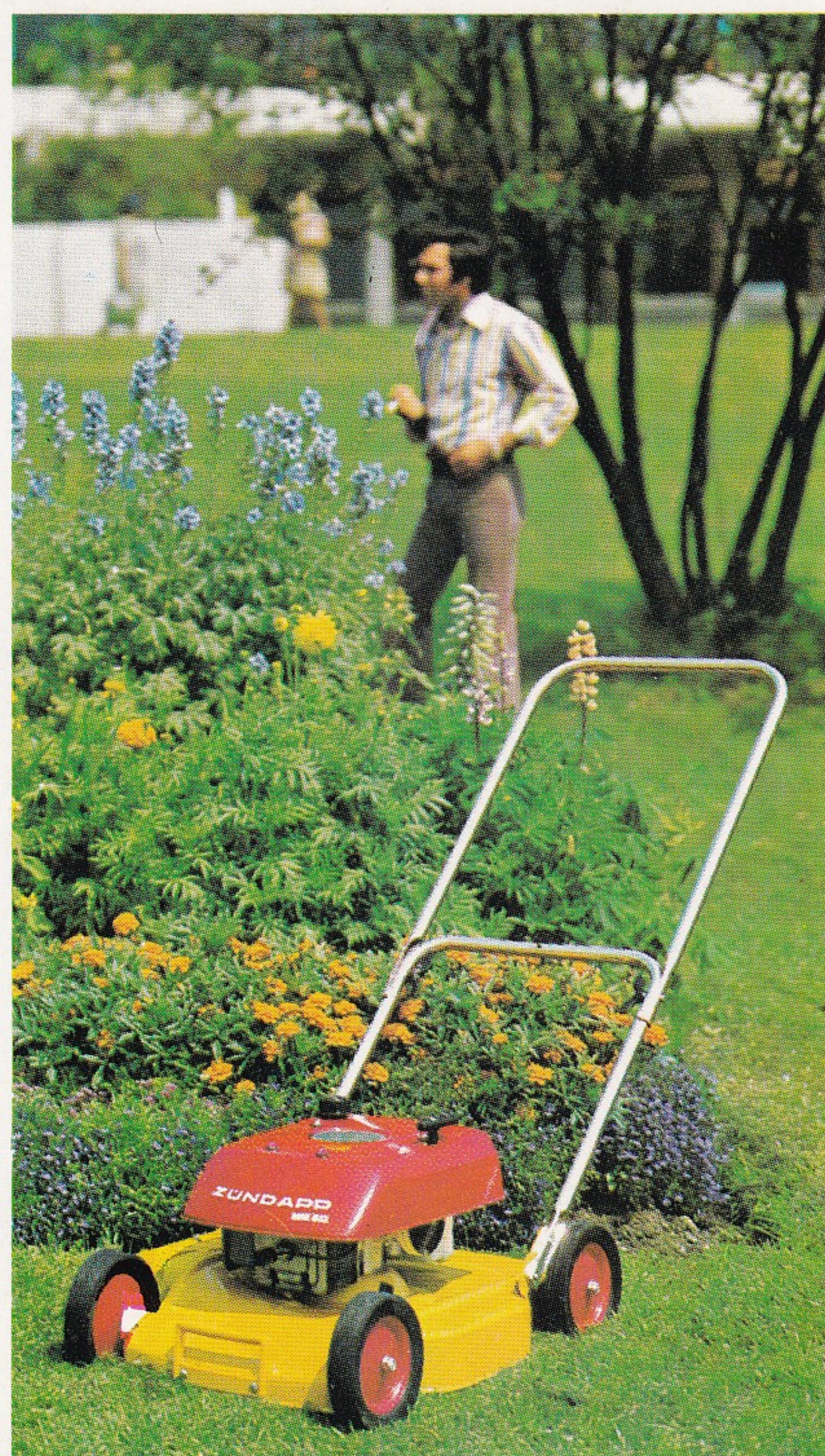
MM 50 Typ 689-01

ZÜNDAPP-Kompakt-Motormäher für größere Ansprüche