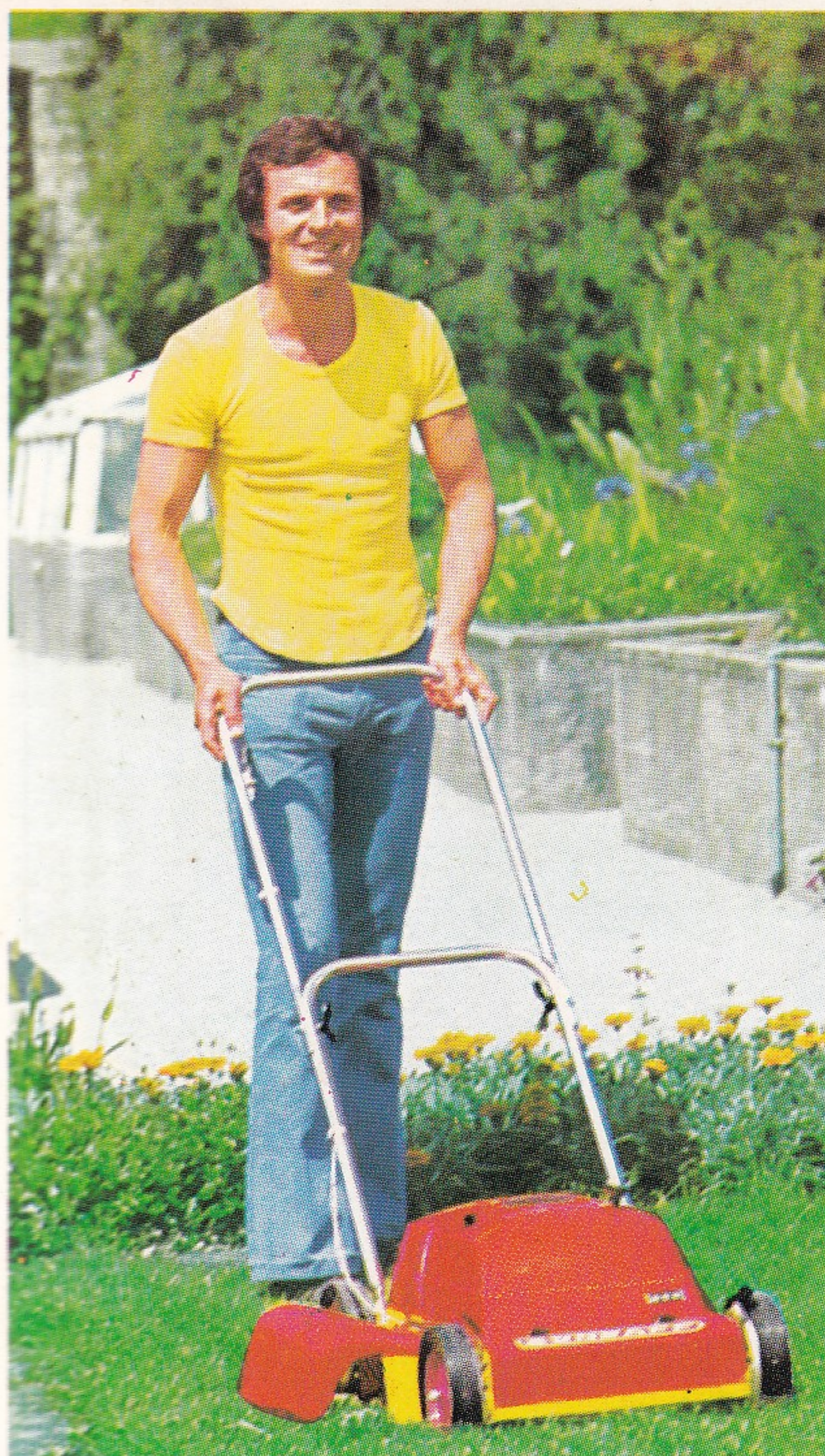
3-Stern-Modell Typ 685-03 ZÜNDAPP-Motor-Mäher — mit Fahrtrieb, Radschnellverstellung, verchromtem Bügel

Für größere Rasenflächen, speziell für Hanglagen. 3-PS-(2,2 kW) ZÜNDAPP-Zweitakt-Motor, 100 ccm. Extrem leise. 2-Finger-Leichtstart. Vorderradantrieb. Sicherheitsgehäuse aus Druckguß. Eingegossener Wurfkanal für optimale Grasförderung.